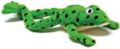
Fred the frog лягушка Фред